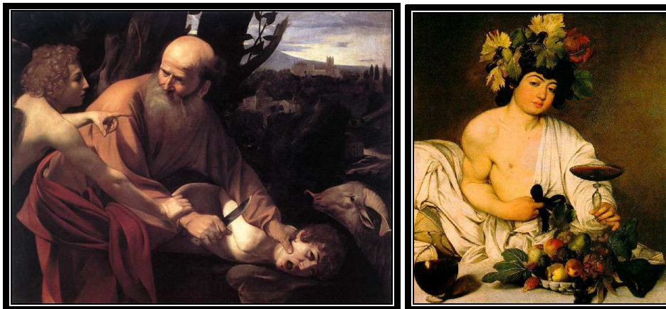
Duas das pinturas citadas: “O sacrifício de Isaac” e “Baco jovem”

Mas apesar da fama crescente (sem fortuna, pois gastava muito mais que o pouco que recebia), Michelangelo continuava um desregrado social: vivia cercado de meninos prostitutos, que usava como modelos de muitos quadros (“ Baco jovem ”, “ O Triunfo de Eros ”, “ São João Batista Menino ”, “ Baco Jovem Doente ”, “ O Tocador de Alaúde ”, “ Jovem com cesto de frutas ” etcétera):