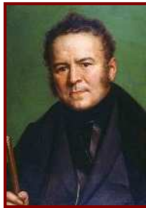
Henri-Marie Beyle, ou Stendhal (Grenoble, França, 23 de janeiro de 1783 - Paris, 23 de março de 1842)

em 1817, Henri-Marie Beyle, nome do escritor mais conhecido pelo pseudônimo Stendhal (autor, dentre outras obras de sucesso, “O Vermelho e o Negro”) foi a Florença; ao visitar a igreja de Santa Croce foi tomado de estranha combinação de sintomas e emoções, com palpitações e tonturas. Um “estranho desassossego” (sic) se apossava dele, já desde as vésperas da ida até lá, antevendo o prazer de fruição artística que sabia esperá-lo; mas quando chegou, extrapolou. O que culminou ao entrar na referida igreja. Descreveu o que sentiu assim (em dois trechos de diário da viagem, que chamou de “Nápoles e Florença: Uma viagem de Milão a Reggio”):